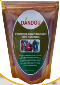
POUDRE DE BISSAP DE BISSAP