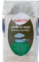
FARINE DE NIÉBÉ