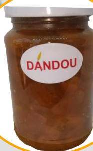
CONFITURE DE MAAD