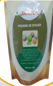
POUDRE DE DITAKH