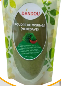
POUDRE DE MORINGA DE MORINGA