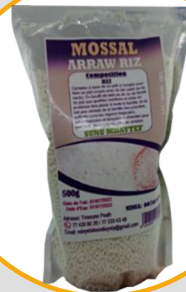
ARROW DE RIZ 500G