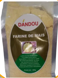
FARINE DE MAIS