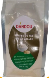
FARINE DE RIZ