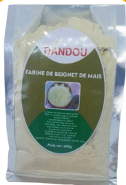
FARINE DE BEIGNETS DE MAÏS