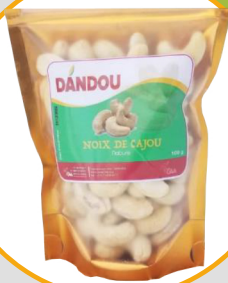
NOIX DE CAJOU NATURE