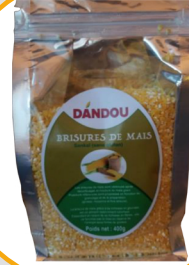
BRISURE DE MAIS