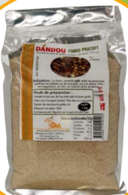
FONIO PRÉCUIT 1KG