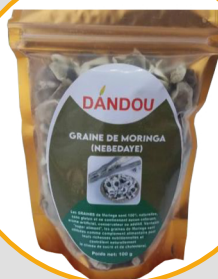
GRAINE DE MORINGA