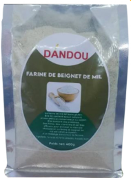
FARINE DE BEIGNETS DE MIL