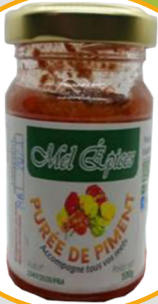
PURÉE DE PIMENT ROUGE