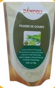
POUDRE DE GOMBO