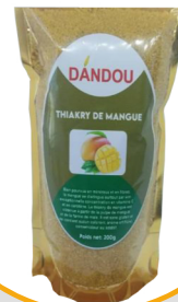
THIAKRY DE MANGUE