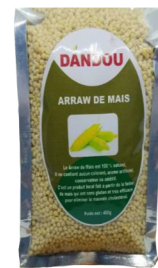
ARROW DE MAÏS