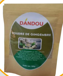
POUDRE DE GINGEMBRE