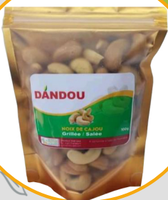
NOIX DE CAJOU GRILLÉE