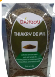
THIAKRY DE MIL