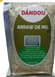
ARROW DE MIL