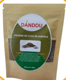
POUDRE DE CLOU DE GIROFLE