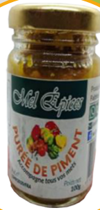
PURÉE DE PIMENT JAUNE