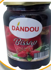
CONFITURE DE BISSAP