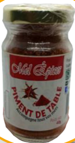
PIMENT DE TABLE